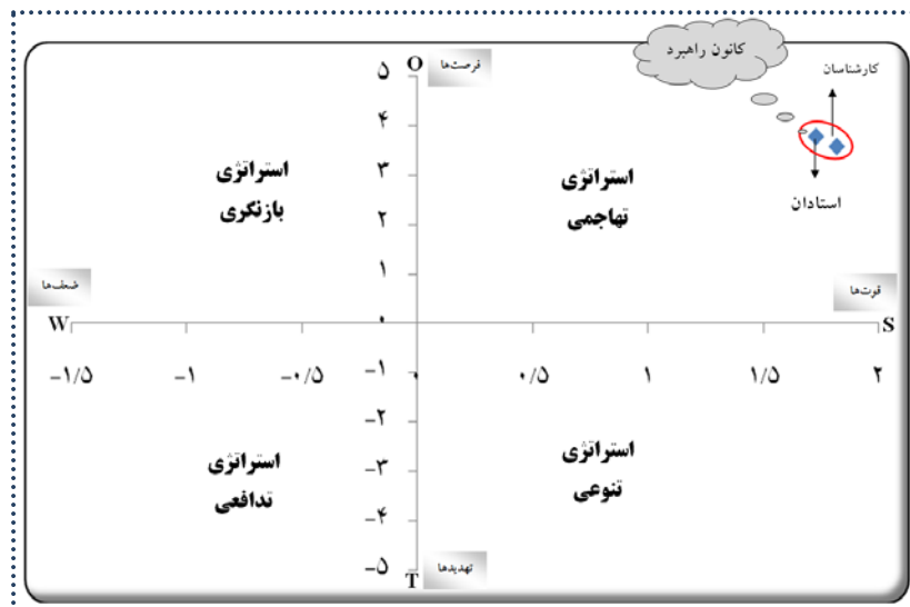
شکل ۲: نمودار تحلیل SWOT برای ارتقاء آموزش توسعه پایدار و محیط زیست در کشور از دیدگاه استادان و کارشناسان

سپس در مرحله بعدی برای دستیابی به مهمترین اولویت‌ها در راهبردهای چهارگانه در زمینه آموزش حفظ محیط زیست و توسعه پایدار اقدام به تشکیل ماتریس عوامل ارائه شده توسط دو گروه گردید تا بر اساس مقایسه دو به دویی عوامل در زیرگروه‌های عوامل بیرونی (فرصت‌ها و تهدیدها) و درونی (قوت‌ها و ضعف‌ها)، راهبردهای چهارگانه رقابتی (SO)، راهبرد تنوع بخشی (ST)، راهبرد بازنگری و تغییر (WO) و راهبرد تدافعی (WT) بهتر شناسایی گردد. سپس در گام بعدی برای دستیابی به نتایج مناسب به تلفیق نظرات نمونه‌ها پرداخته شد که در راستای تحلیل وضعیت کشور بر مبنای اهداف ESD بر اساس مدل راهبردی ترسیمی راهبردهای چهارگانه عبارتند از (جدول ۵):